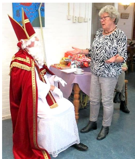
anderen hadden wat uit te leggen!