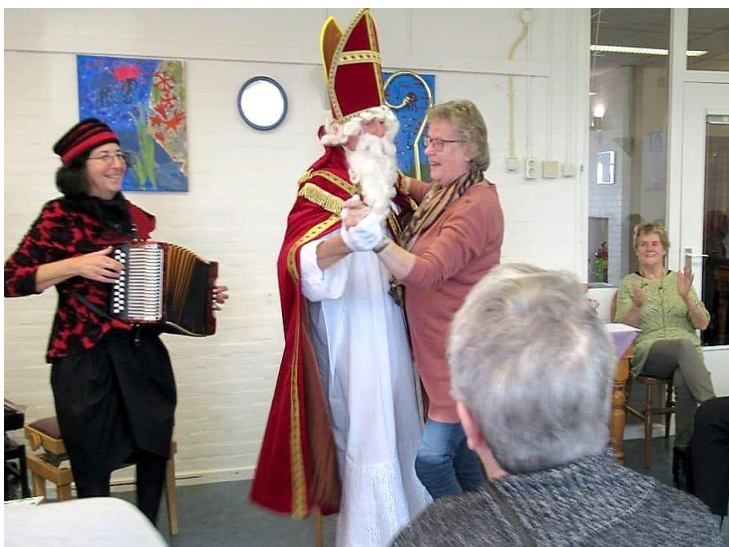
Sommigen mochten een dansje maken met de Sint ...